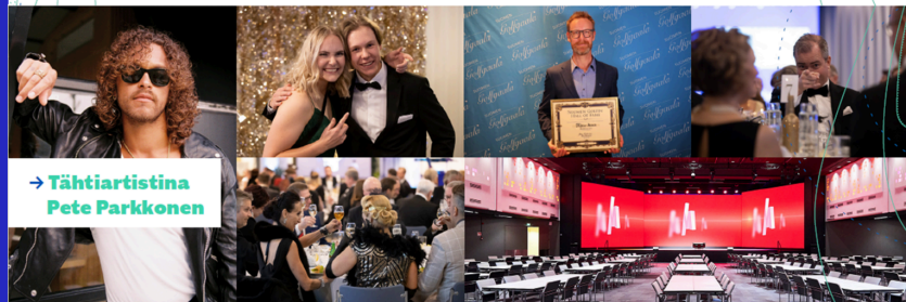
→ Tähtiartistina Pete Parkkonen