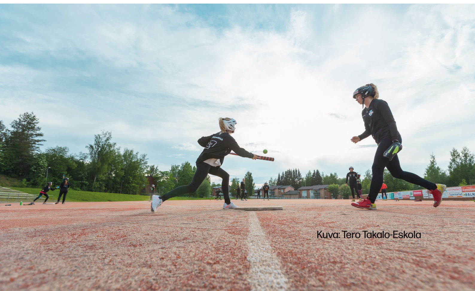
Kuva: Tero Takalo-Eskola

Lisätietoja löydät hakusanalla ”Erasmusplus yleissivistävä” tai linkistä.