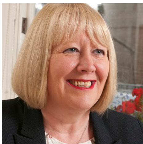
Wendy Cole Golf Course 2030

LÅNGVIK CONGRESS WELLNESS HOTEL, KIRKKONUMMI