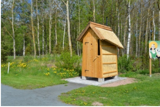
Rakennelmasta puuttuvat rappunen ja kaide, mitkä ovat helppo korjata.