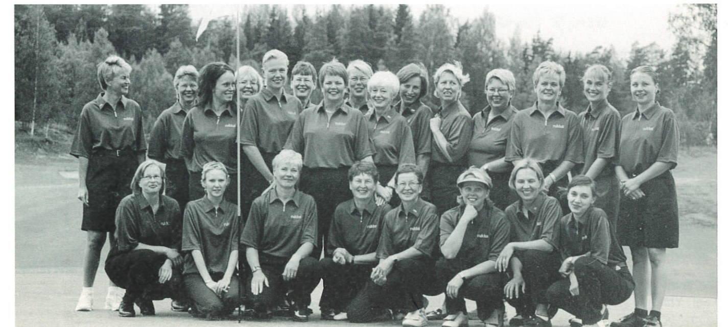
LadyGolf toiminnassa pelattiin ensimmäistä kertaa Ryder-Cup tyyppinen joukkuekilpailu NiceCup Uusimaa vastaan muu Suomi.

LadyGolf-toiminta tavoitti sekä vasta-alkajia että kokeneempia harrastajia. Toimintaan sisältyi eri puolilla maata samanaikaisesti järjestetty valtakunnallinen laji-esittely, valtakunnallinen Naisten Sunnuntai, jolloin useissa seuroissa lajia harrastamattomillakin naisilla oli mahdollisuus tutustua siihen. Naisten Ryder Cup-tyyppinen joukkuekilpailu NiceCup loppukilpailuineen kohdistettiin kokeneemmille pelaajille. Molemmat tapahtumat järjestettiin nyt ensimmäistä kertaa.